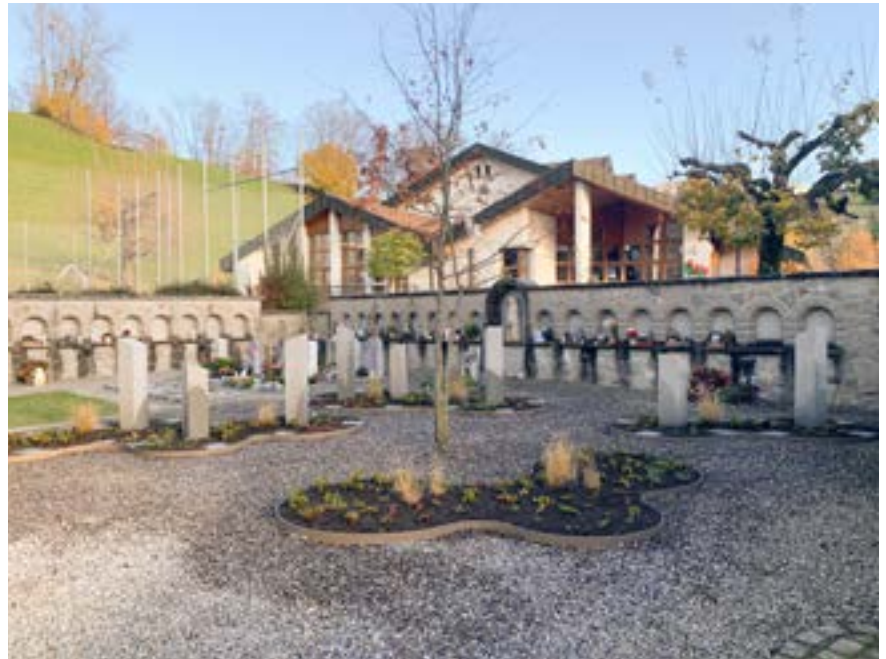
■ Der neu gestaltetet Friedhof in Rieden bietet auch Platz für Urnen-Erdbestattungen.

Bei den Urnenstelengräbern werden die Urnen im Pflanzenstreifen vor der Stele fortlaufend beigesetzt. Die Beschriftung