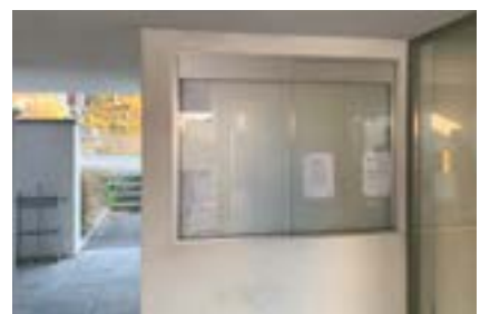
■ Der Anschlagkasten in Rieden wird mit dem Umzug aufgehoben.

Der Anschlagkasten in Rieden steht im Zusammenhang mit dem Umbau und der Umnutzung des ehemaligen Gemeindehauses nicht mehr zur Verfügung und wird mit Beginn der Umbauarbeiten ausser Betrieb genommen. Der Anschlagkasten in Ernetschwil wird mit dem Umzug ins neue Gemeindehaus in Gommiswald aufgehoben.