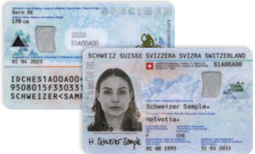
■ Ab dem 3. März erhältlich: Neue Identitätskarte.

Die Preise sowie das Ausstellungsverfahren bleiben unverändert. Die Identitätskarte kann beim Einwohneramt der Wohngemeinde beantragt werden. Dazu ist ein aktuelles Passfoto gemäss den Kriterien mitzubringen, sofern vorhanden die alte Identitätskarte oder bei Verlust, die Verlustanzeige der Polizei. Minderjährige oder Personen unter umfassender Beistandschaft müssen von ihrer gesetzlichen Vertretung begleitet werden.