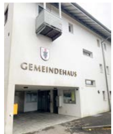
■ Das ehemalige Gemeindehaus hat eine Aussensanierung nötig.