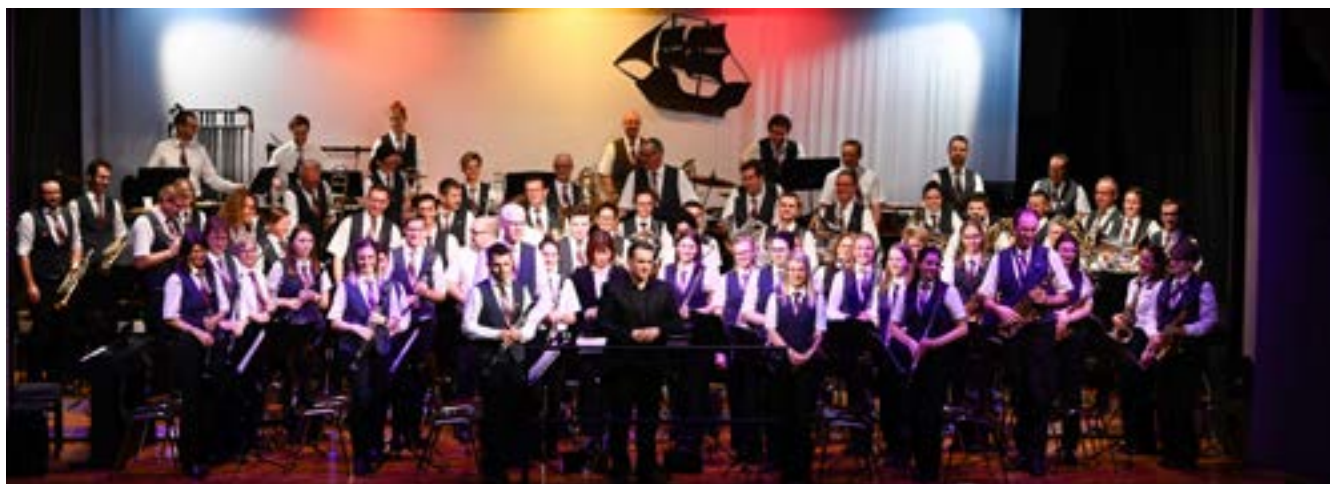
■ Die Musikgesellschaft Alpenrösli am Jahreskonzert.

Momente machten unsere Jahreskonzerte zum vollen Erfolg. Deshalb möchten wir uns an dieser Stelle bei allen Konzertbesuchern bedanken. So macht unser Hobby gleich noch mehr Spass!