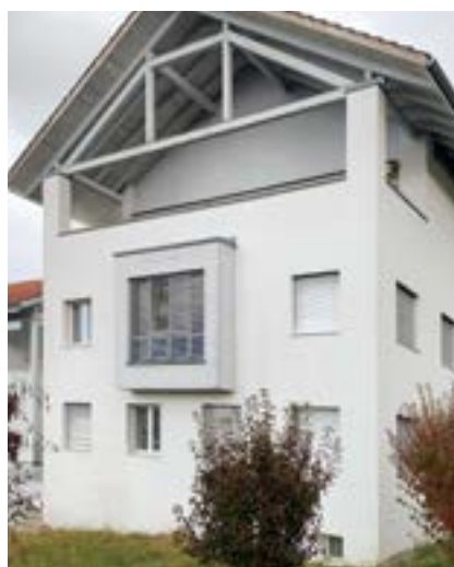
■ Auf der Südseite erhalten die Wohnungen eine Loggia als Terrasse.

Mit den Bauarbeiten soll Mitte März 2023 begonnen werden und dauern bis Ende November 2023. Die Wohnungen werden im Sommer zur Vermietung ausgeschrieben und sind per Ende 2023 bezugsbereit.