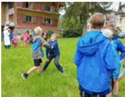
■ Das erste Geländegame der Jubla findet am 25. März statt.

Bald schon ist es so weit und das erste «Gommi-Gländgame» der Jubla Gommis-