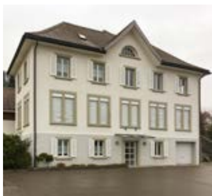
■ Ehemaliges Schulhaus Gebertingen

«Die Schulhausliegenschaft in Gebertingen, Parz. 378E, ist weiterhin für die Öffentlichkeit zugänglich und nutzbar zu erhalten. Der Gemeinderat wird beauftragt, ein Projekt auszuarbeiten, dass der Bevölkerung von Gebertingen einen Treffpunkt für gesellschaftliche und kulturelle Veranstaltungen ermöglicht. Der Spielplatz/Hartplatz ist zu erhalten.»