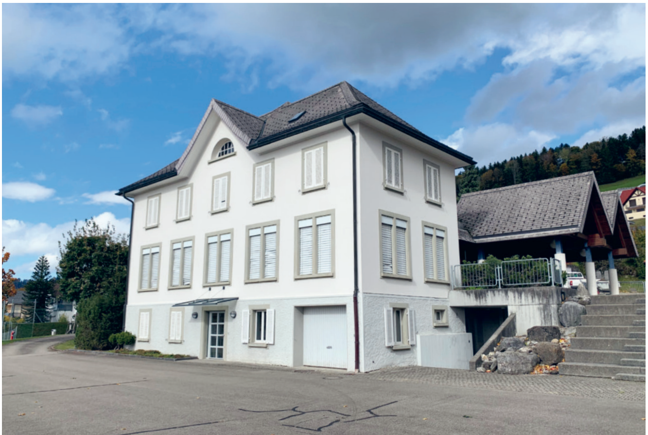
Das ehemalige Schulhaus Gebertingen mit Vorplatz.

Heisst die Bürgerschaft die Volksmotion gut, arbeitet der Gemeinderat innert Jahresfrist eine Vorlage aus.