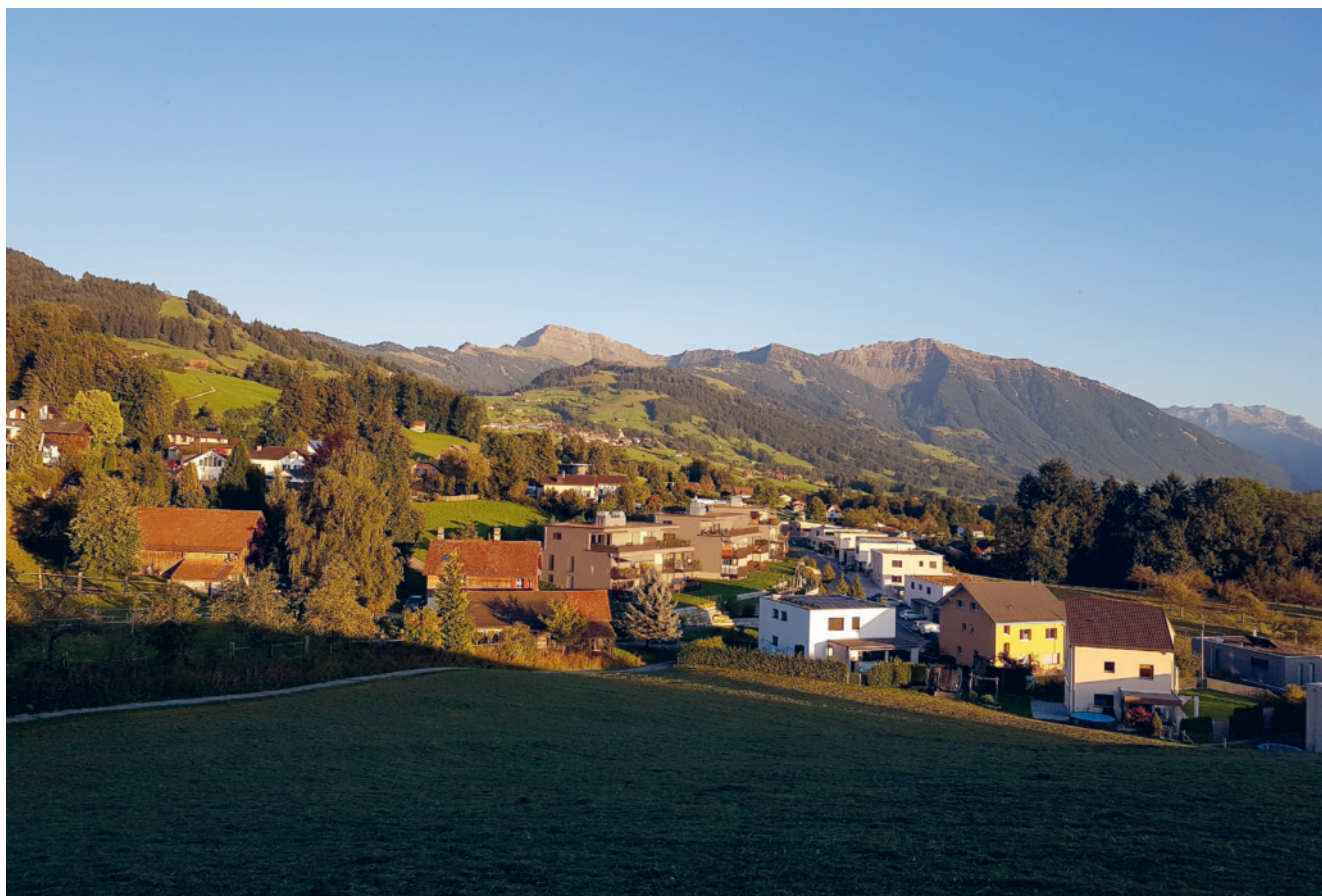
Sicht auf den Speer

«Der bestehende Hartplatz auf GS-Nr. 378E ist für die Öffentlichkeit zugänglich und nutzbar zu erhalten. Das Schulhausgebäude ist abzubauen. Der Schutzraum ist zu erhalten und instand zu stellen.»