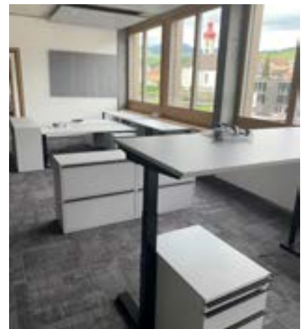
■ Die Gemeindeverwaltung zieht in die neuen Büros ein.

Zum Teil mussten laufende Geschäfte verschoben und Prioritäten neu gesetzt wer-