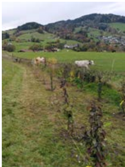
■ Die Hecke gedeiht prächtig.

Am 24. Juni 2023, von 10.00 bis 12.00 Uhr, findet die nächste öffentliche Gartenführung im Kloster Berg Sion, mit Wilfried Oesch statt. Nutzen Sie die Gelegenheit, unseren Permakulturgarten im geschlossenen Kloster zu besichtigen und dabei viele interessante Informationen über die Entstehung und Entwicklung zu erfahren.