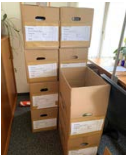
■ Die Zügelkisten warten auf den Abtransport.

In den letzten Wochen wurde auf der Baustelle des neuen Gemeindehauses und Feuerwehrdepots intensiv gearbeitet. Die letzten Türen wurden montiert, die Möbel aufgebaut und die technischen Installationen geprüft. Die Reinigungskräfte putzten die letzten Anzeichen einer rund zweijährigen Baustelle weg. Während die Umgebungsarbeiten noch fertiggestellt werden, ist die Gemeindeverwaltung bereit für den öffentlichen Betrieb.