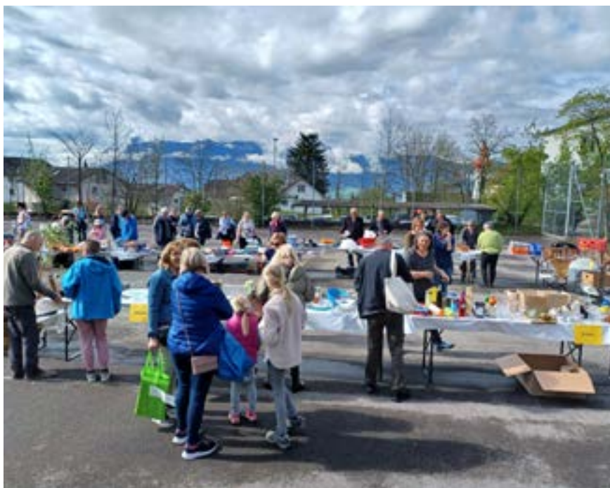
■ Der Bring- und Holtag wurde rege genutzt.

Der Bring- und Holtag war ein gemeinsames Projekt der Politischen Gemeinde Gommiswald, der Juma Gommiswald und