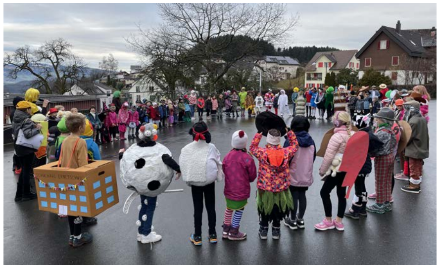
■ Die Kinder genossen die Fasnacht in der Schule Ernetschwil.

Nach der Pause wurden die Schülerinnen und Schüler in altersdurchmischten Grup-