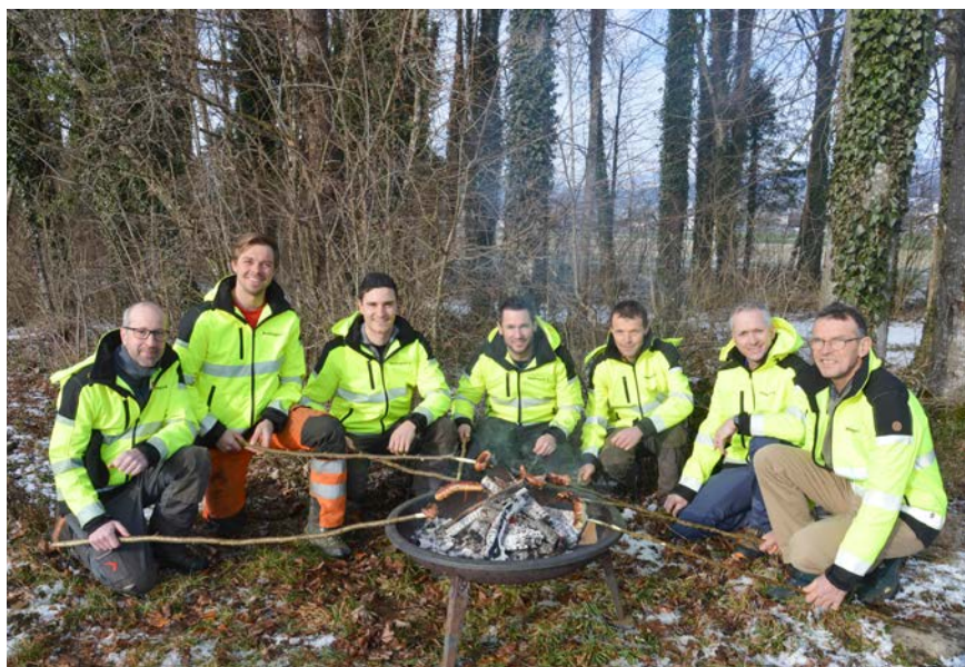
■ Der Forstverein See lädt zu einem RUNDUM BÄUMIGEN und erlebnisreichen Wochenende.

Samstag/Sonntag, 9./10. März 2024 jeweils ab 10.00 Uhr Waldlehrpfad in Kaltbrunn