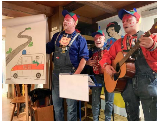
■ Die Spitzbueben erfreuten mit ihrer Darbietung.

Bim leere Schuelhuus z Gebertinge, tüend dunkli Wolke grad ufzieh, debi sind d Schuele im Linthgebiet, idä Medie wie no nie. Für gueti Bildig hett mer s Huus, scho lang vermiete müesse, es gäbt au Intressänte, d Firma Läderach laht grüesse.