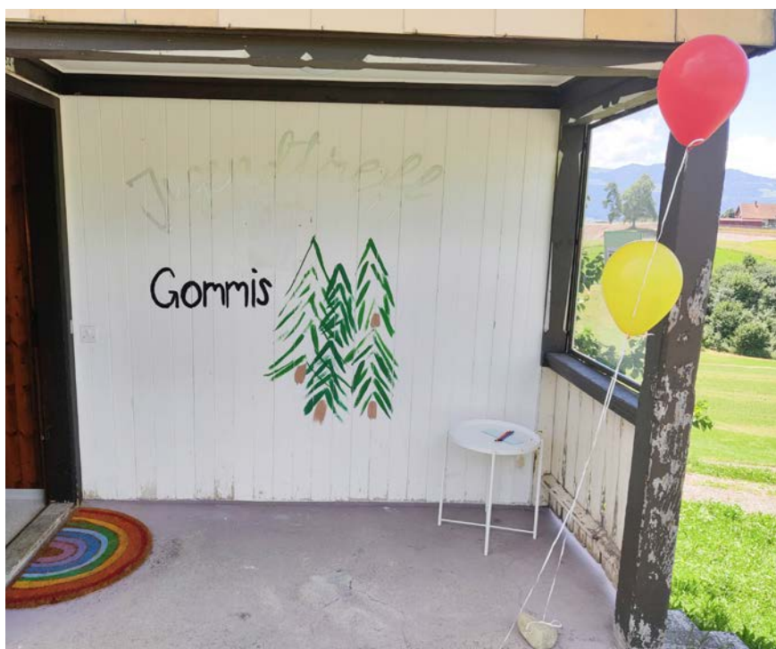
■ Das Team des Jugendtreffs freut sich auf rege Teilnahme an den Anlässen.

• Freitag, 26. April, 19.00–21.30 Uhr: Kino Abend im Jugendtreff mit Popcorn und Getränken, dem Alter der Teilnehmer angepasster Film.