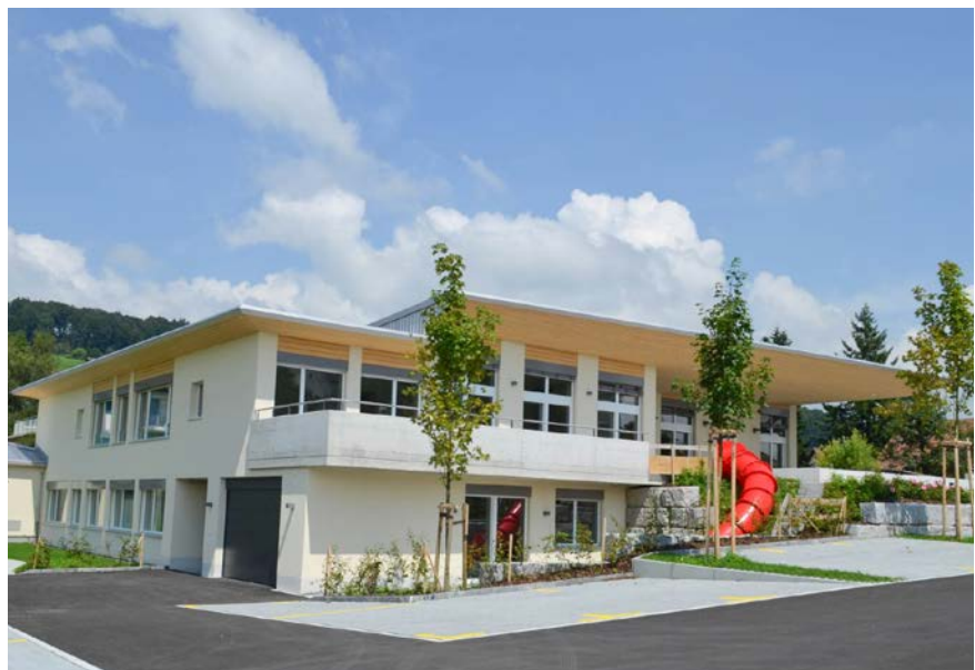
■ Das Generationenhaus in Eschenbach feiert sein 10-jähriges Jubiläum.