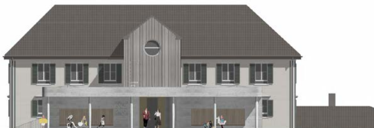
■ Mit dem geplanten Erweiterungsbau können zusätzliche Räumlichkeiten und eine optimale Anbindung an das Primarium realisiert werden.

Dienstag, 26. März 2024, 19.30 Uhr Gemeindsaal Gommiswald