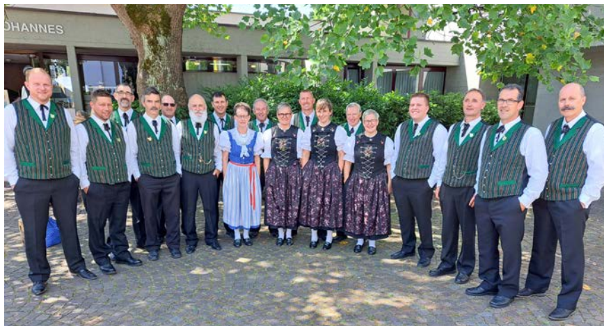
■ Der Jodelklub Gommiswald freut sich auf euren Besuch.

Öb en flotte Juiz, ein lebensfrohes Lied oder eine alte Volkswaise – unser Liederrepertoire ist vielseitig und wird mit grosser Freude vorgetragen.