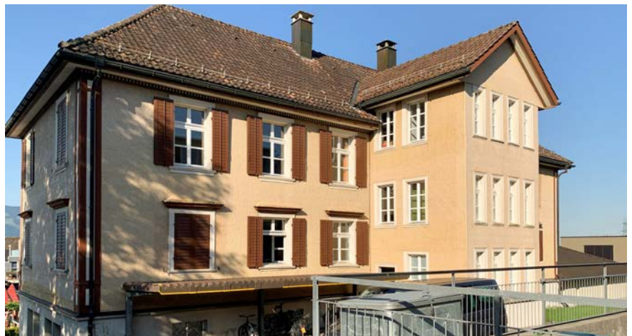
■ Der heutige Kindergarten soll saniert werden.

Die Sanierung des denkmalgeschützten Gebäudes zielt darauf ab, die historischen und schützenswerten Bereiche des Gebäudes zu erhalten und gleichzeitig moderne Anforderungen zu erfüllen. Dazu gehören die Dämmung der Aussenwände, die Entfeuchtung erdberührter Wände, der Austausch der Fenster unter Berücksichtigung denkmalpflegerischer Aspekte sowie die Überprüfung und Reparatur des Dachs und der Dacheindeckung aus den 1940er Jahren.