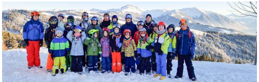
■ Die Pfadi Regulastein konnte den Schlittelpausch erfolgreich durchführen.

bereich ein, wo wir von bereits wartenden Eltern empfangen wurden. Die Abfahrt endete mit viel Gelächter, Freude und ohne Unfälle. Es war ein gelungener Schlittelpausch.