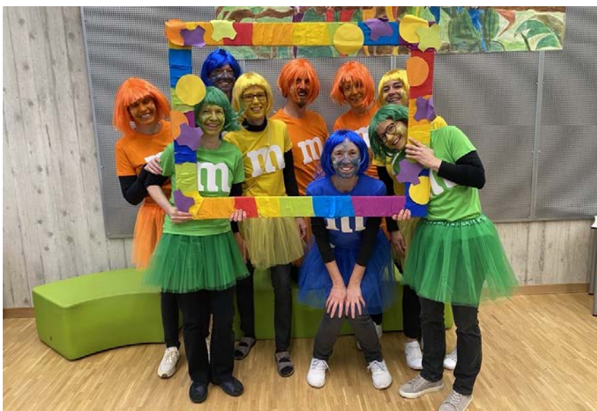
■ Auch die Lehrpersonen hatten einen grossen Spass!

Die Schulfasnacht in Ernetschwil war ein voller Erfolg und wird den Kindern sicherlich noch lange in Erinnerung bleiben. Ein herzliches Dankeschön geht an alle OrganisatorInnen, Eltern und HelferInnen, die diesen tollen Tag möglich gemacht haben.